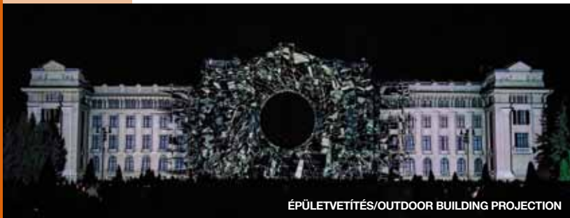
ÉPÜLETVETÍTÉS/OUTDOOR BUILDING PROJECTION

A látogató Debrecenben az év bármelyik időszakában pezsgő fesztiválba, ínycsiklandó ízekkel csábító gasztronómiai rendezvényekbe csöppenhet, melyek a helyi értékek, hagyományok megőrzésén túl a modern trendeket is követik. Ha minden egyes debreceni rendezvényt egy-egy színnel jelölnénk, a fiatalok kedvencének számító Campus Fesztiváltól a kortárs kórusmuzsikát népszerűsítő Bartók Béla nemzetközi kórusversenyig, végtelen színskála tárulna elénk.