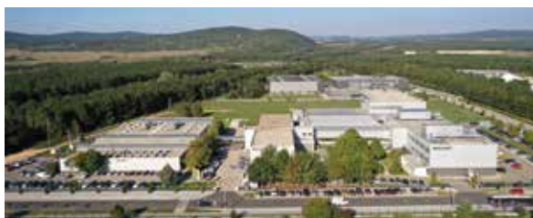
„Balluff-Elektronika Kft.” Veszprém

Ügyfeleink érzik azt a különleges elkötelezettséget, amivel értük dolgozunk, amellyel megfelelnék az igényeiknek, elfogadjuk kihívásait és jövőbe mutató technológiákat fejlesztünk ki a számukra. Tudjuk, hogy ügyfeleink jól felkészültek a jövőre, és mi mindenben támogatjuk őket. Ezért az „innovatív automatizálás” a jelmondatunk.